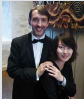
SHIN-YOUNG LEE UND OLIVIER LATRY

Shin-Young Lee und Olivier Latry (Notre Dame, Paris)